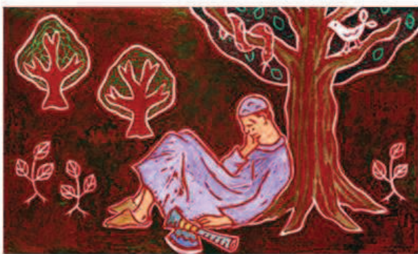
"Le bûcheron Akalam"