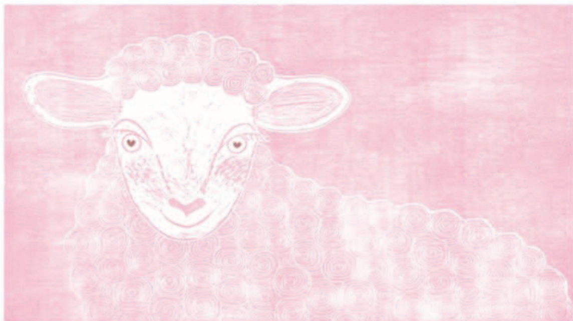
La brebis amoureuse