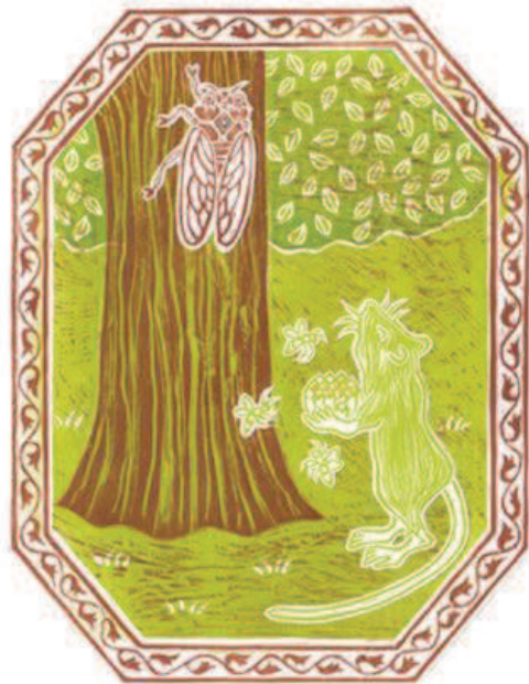
"Le mariage de la cigale"