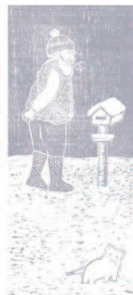
"D'une saison à l'autre"