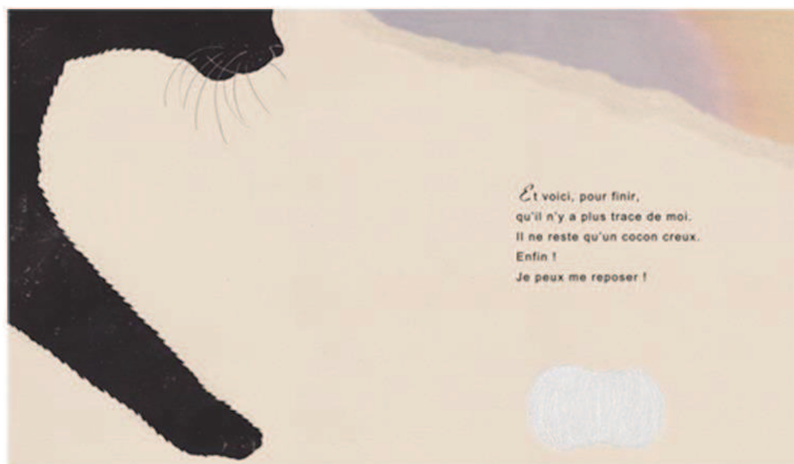
"Le Cocon Rouge" la gravure en carton