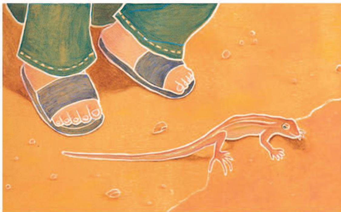
" A special friend " la gravure en bois