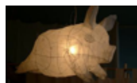
LIKA KATO INSTALLATIONS