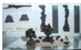
MICHÈLE RIZET PEINTURE