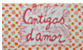
PAOLA AFONSO LINOGRAVURE