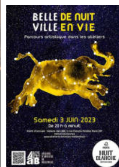
Bal néoTango (photo Lika Kato), œuvres de Colette Billaud (ph. Colette Billaud), installation/performance l'Air de Rien (ph. Anne Girard Le Bot), et affiche de l'événement.

Un bilan est très riche avec beaucoup d'invité.e.s, un grand nombre de propositions formulées pour l'occasion, belles et variées, et un public au rendez-vous (en particulier, les événements ont tous affiché complet quand ils étaient en intérieur)... et beaucoup de retours directs très enthousiastes. Rendez-vous l'année prochaine