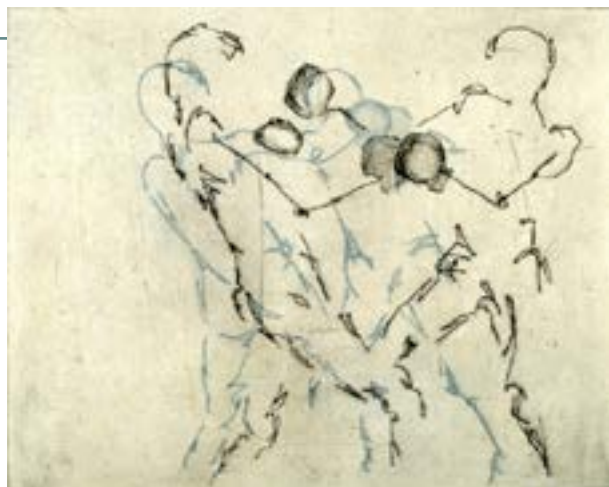
“boxers”- burin&chine collé - 80x60cm-2006