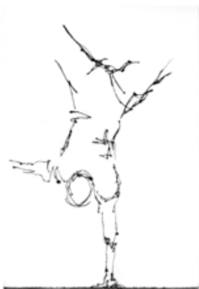
“Equilibriste I” burin - 50x70cm - 2005