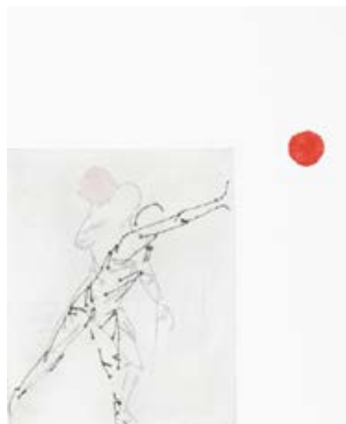
“Move III ” burin&chine collé - 40x60cm