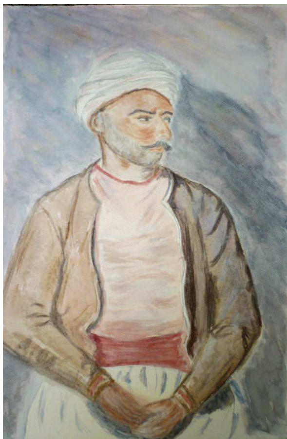
Mustapha d'après Géricault, aquarelle sur papier, 30 x 20 cm, 2017