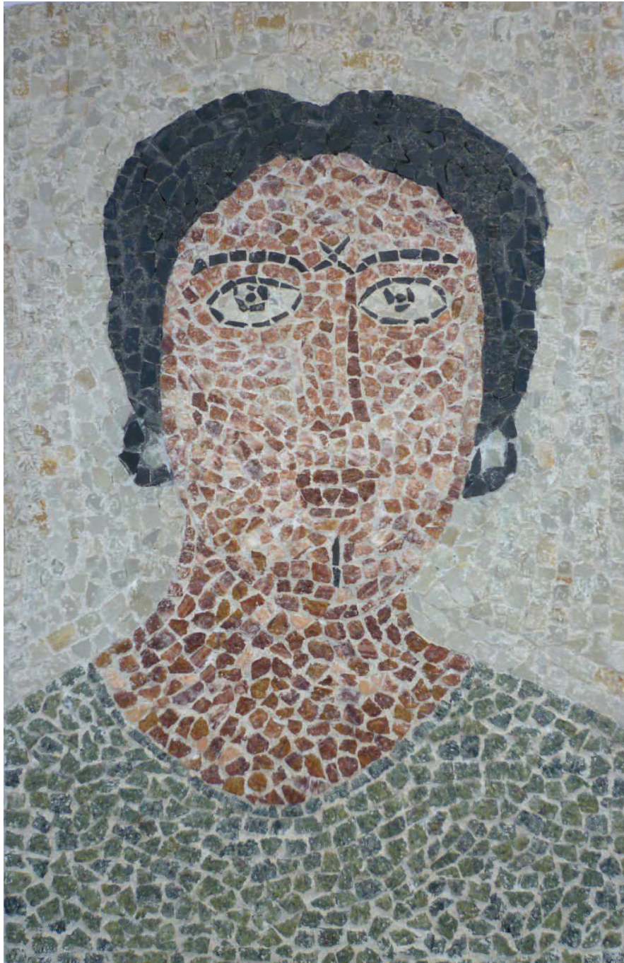
Autoportrait, mosaïque romaine, 32 x 21 cm, 2008