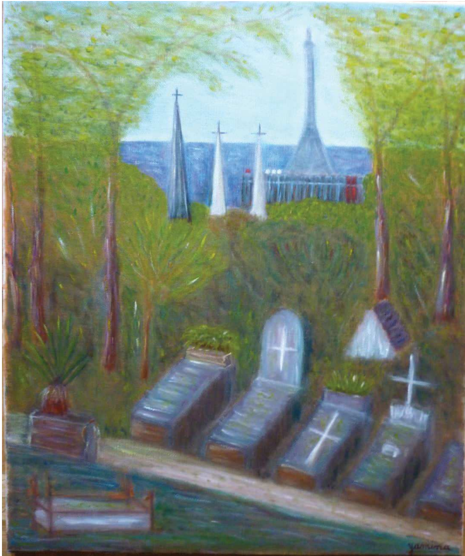
Cimetière du Père Lachaise, huile sur toile, 55 x 46 cm, 2015