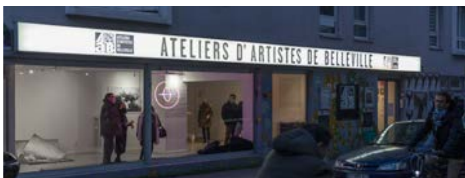
Vitrine de la galerie des AAB lors de l'exposition (Un)jité en 2021.

Points d'accueil du public pendant l'événement (plans, informations...) : Galerie des AAB, 1 rue Picabia, Paris 20e. (M°Couronnes)