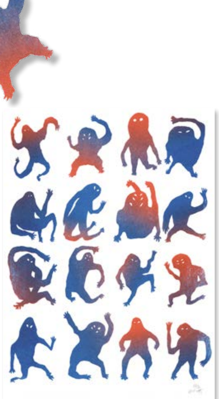
Saint-Oma, Les sales trognes, Risographie, 2020 © SaintOma

Plus d'œuvres sur son site : saintoma.com