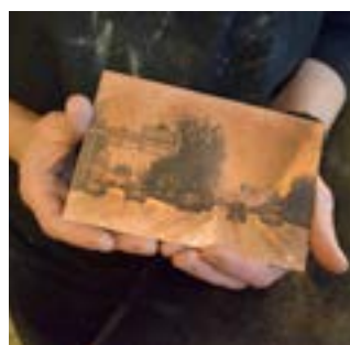
Plaque de gravure de Caroline Bouyer.