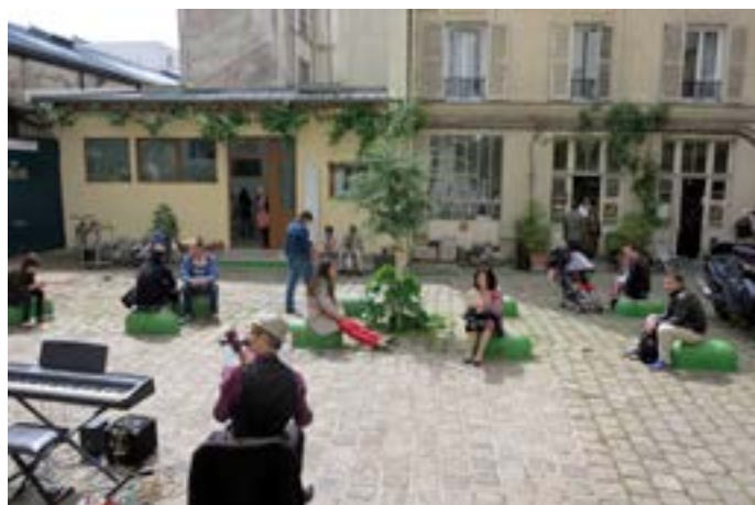
Vue des ateliers de la cour Ramponeau.