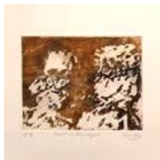
Gravure de Françoise Gasser.