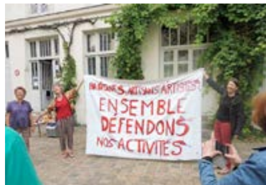
Le Collectif Ramponeau en 2015.