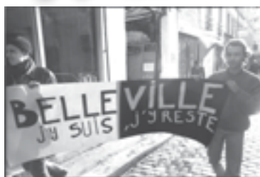
Mobilisation des artistes en 1994.