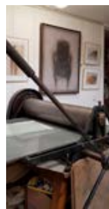
Presse dans l'atelier de Catherine Rauscher