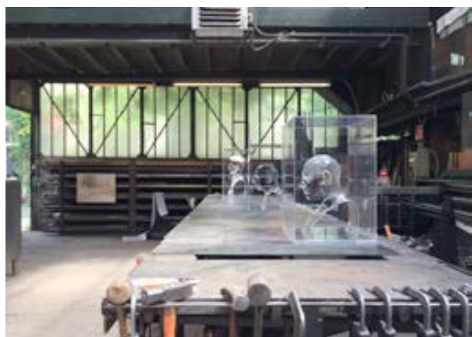
Vue de l'exposition La puissance de l'humble.