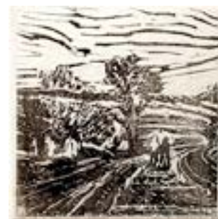
Route de campagne, gravure s/ papier contre-collé s/ toile de Véronique Desmasures. © Véronique Desmasures