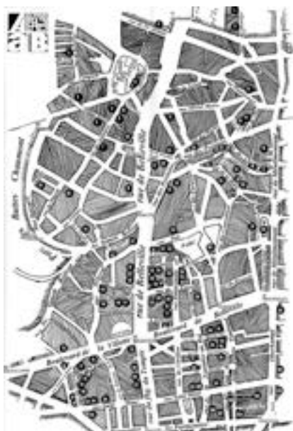
Ancien Plan des Portes Ouvertes des Ateliers d'Artistes de Belleville.

Un projet encore en cours d'élaboration, en co-construction avec différents acteurs du secteur, qui donnerait par exemple naissance à un espace artistique mutualisé.