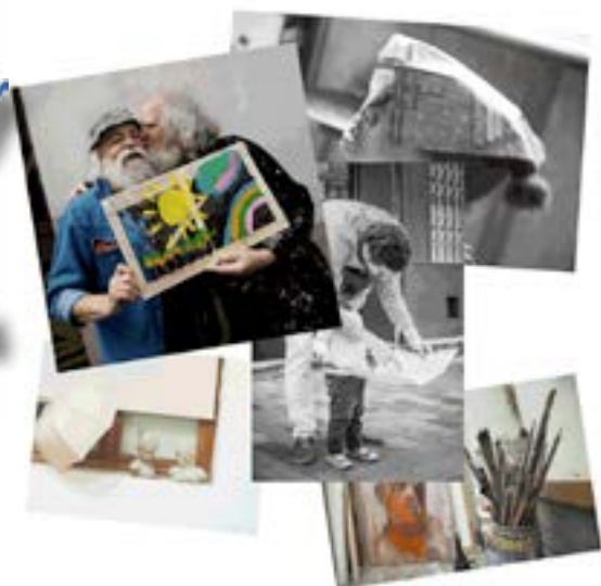
Exemples d'œuvres pour le concours photo.