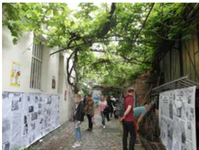
Affichage au fond de la cour Ramponeau, lors des Portes Ouvertes des AAB en 2019.