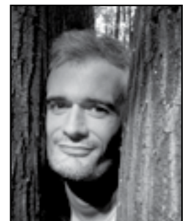
Portrait de Saint-Oma