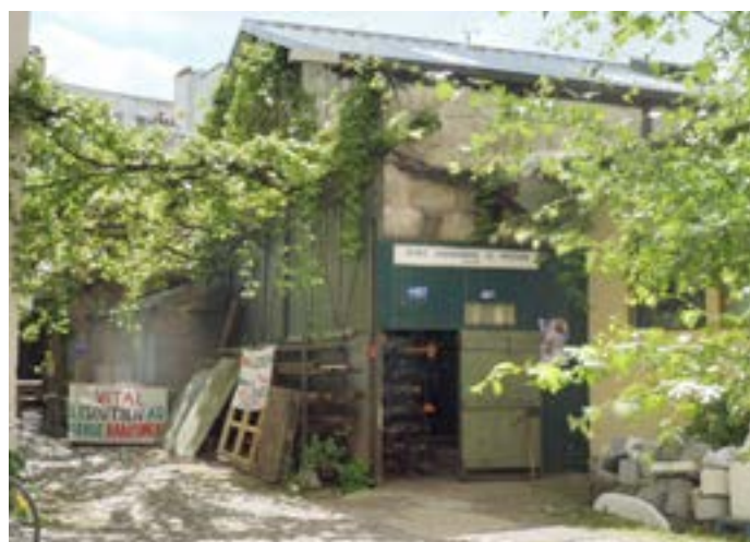
La Métallerie Grésillon vue de l'extérieur.