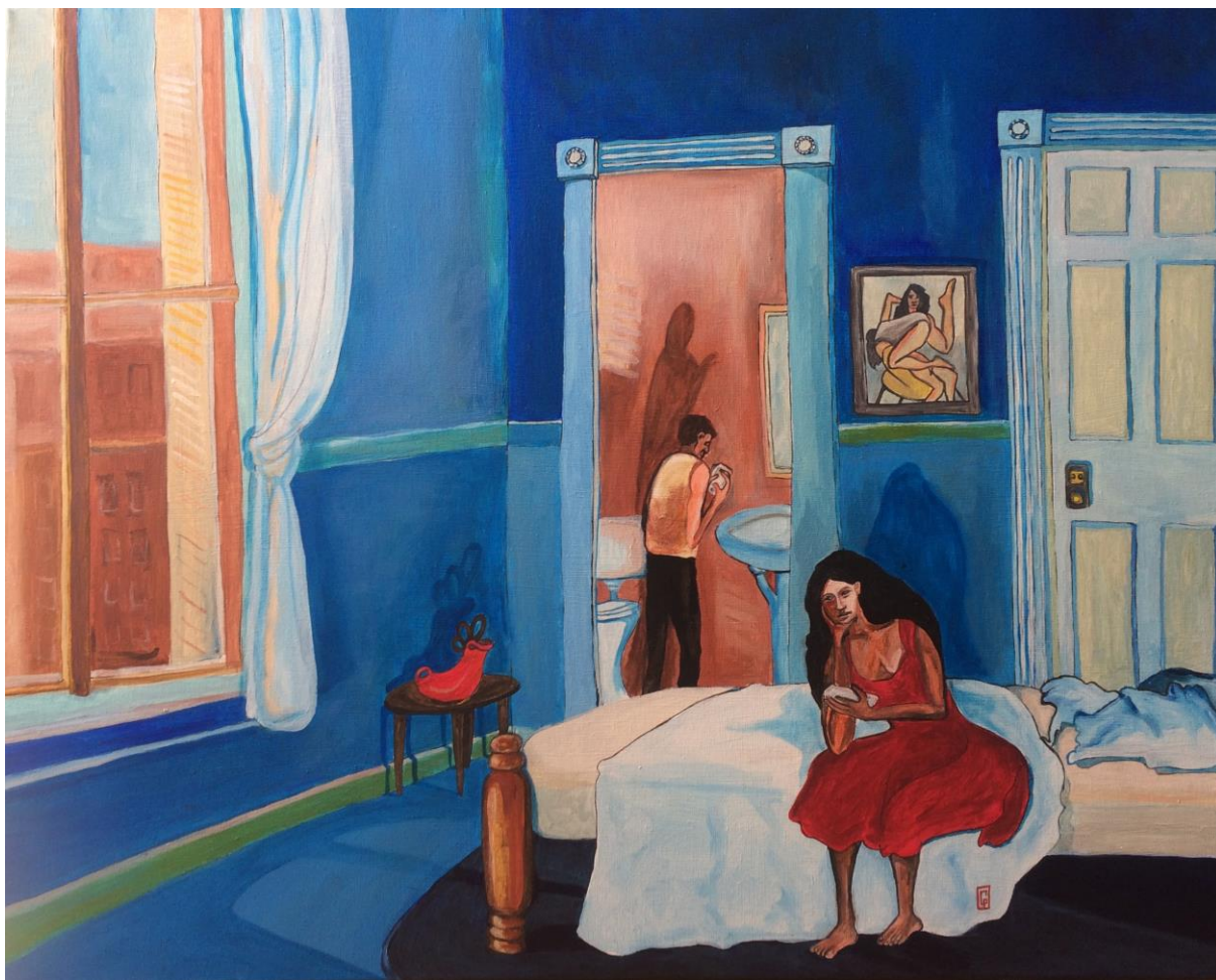
La Chambre, acrylique sur toile, 65 x 81, 2017