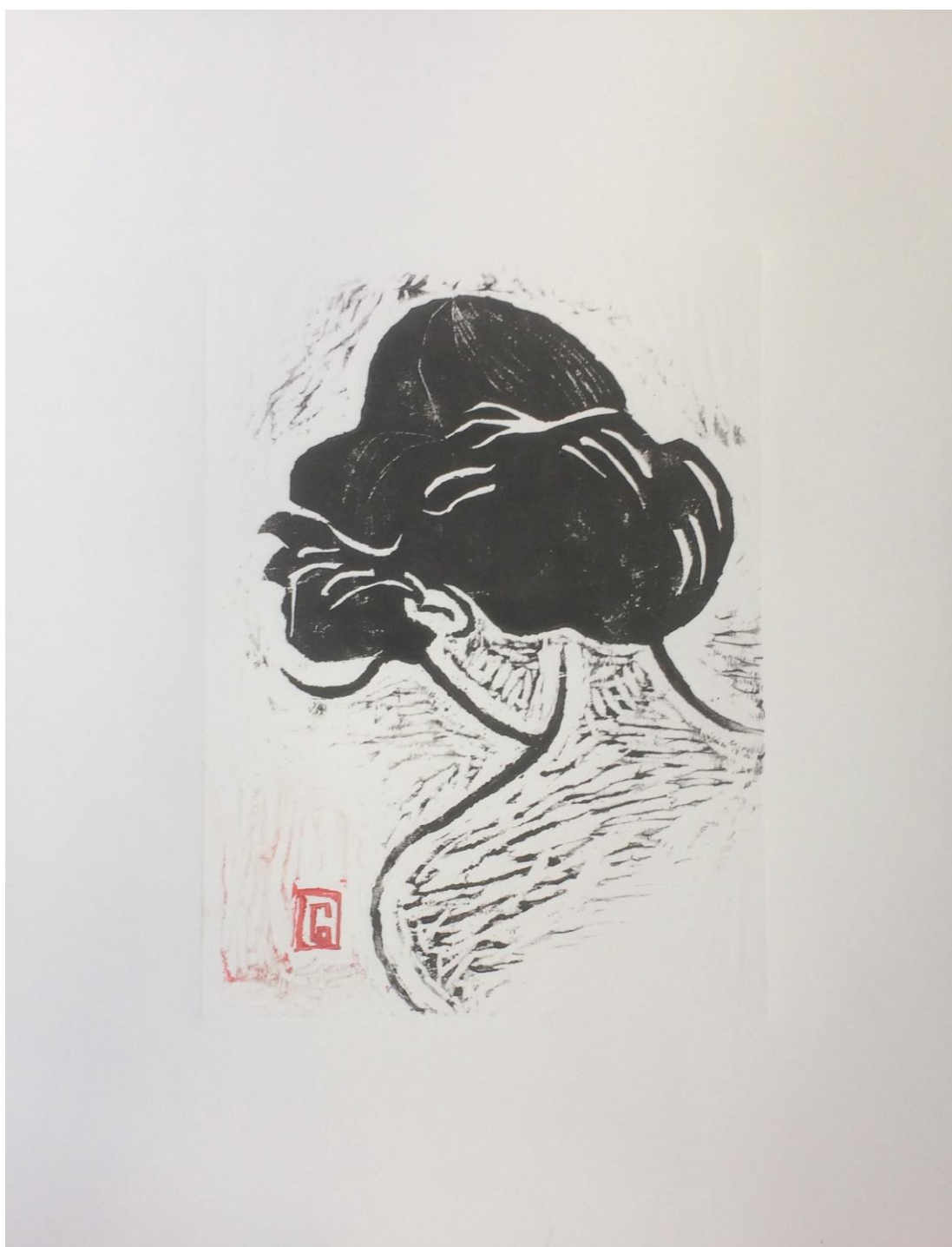
La Coiffure, gravure sur bois, 40 x 50, 2017