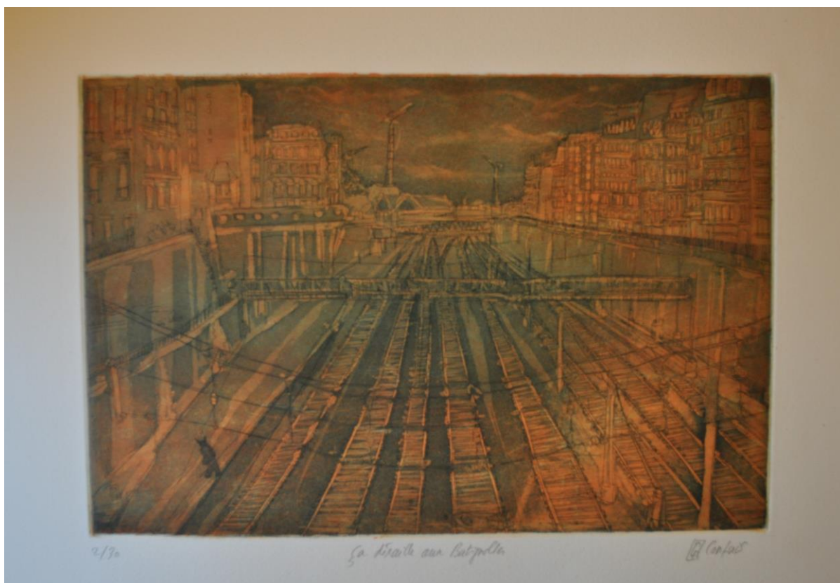
Ça déraile aux Batignolles, eau forte et techniques mixtes en taille douce, 2016