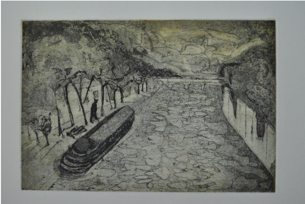
Titre : La Seine du Crime (série les Mystères de Paris) Technique : Eau forte, pointe sèche, aquatinte et burin sur plaque de cuivre, tiré sur papier Velin 40 x 50 cm Format : matrice 20 x 30 sur papier 40x50 Tirage en 30 exemplaires numérotés signés Année de réalisation : 2016-2018