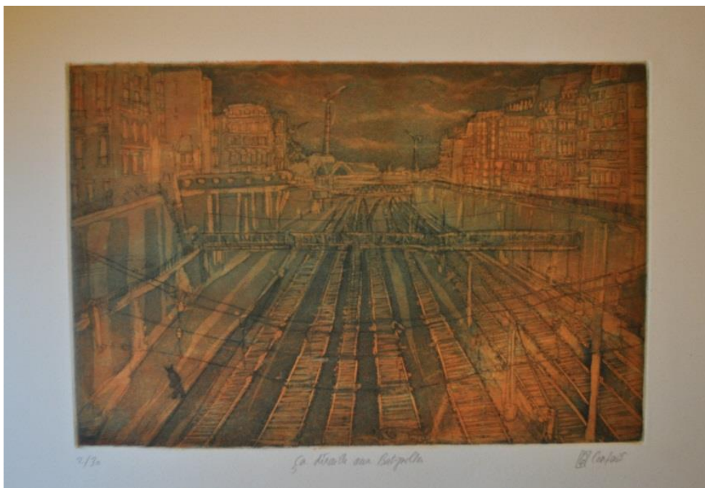
Titre : ça déraile aux Batignolles (série les Mystères de Paris) Technique : Eau forte, pointe sèche, aquatinte et burin sur plaque de cuivre, tiré sur papier Velin 40 x 50 cm Format : matrice 20 x 30 sur papier 40x50 Tirage en 30 exemplaires numérotés signés Année de réalisation : 2016-2018