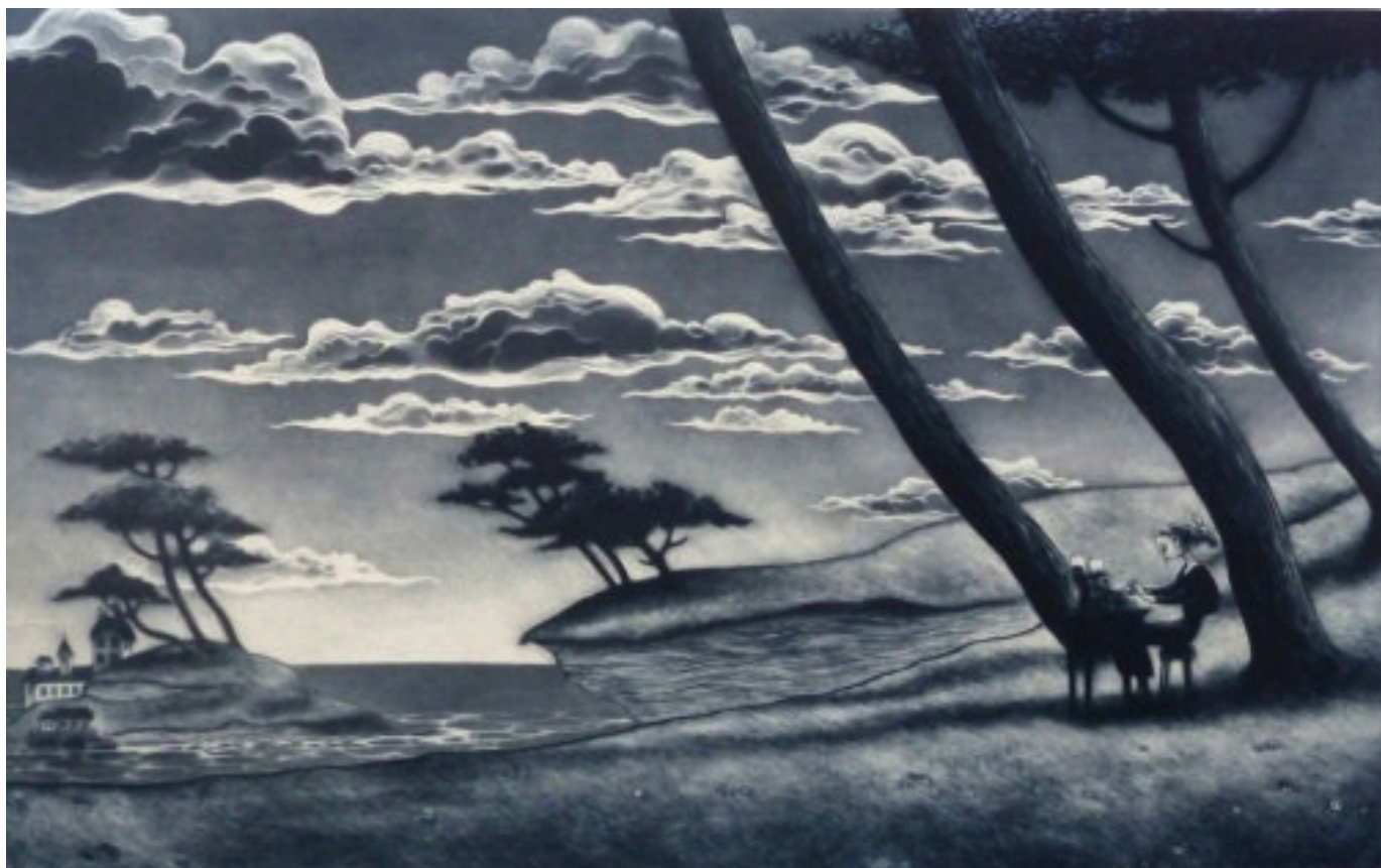
It was a dark and stormy night, 2017