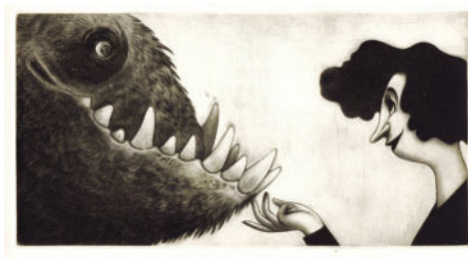
« Taming the Tiger », 2018