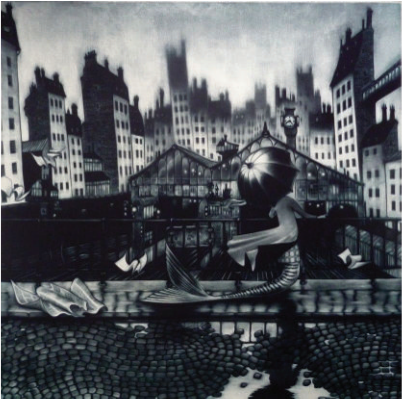
La sirène de 17 h. 39, 2018